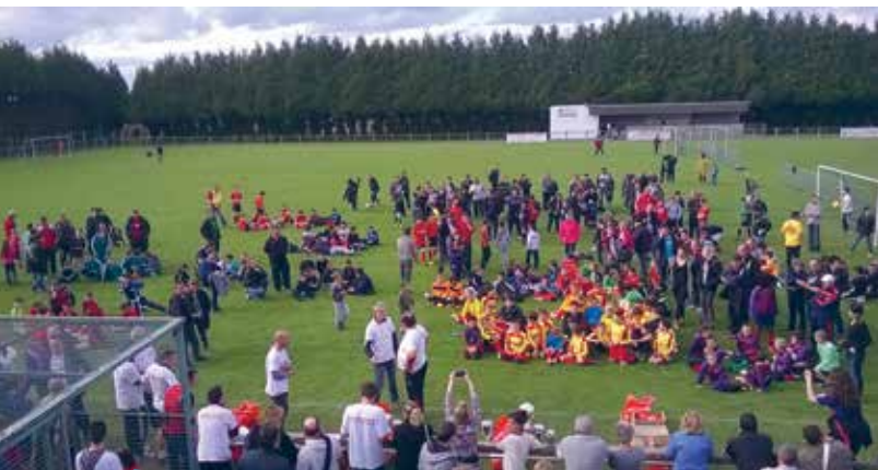
Trophée AELWEZ du 22 avril 2017

L'amicale Dolaysienne football avait 133 licenciés lors de la saison 2016/2017, ce nombre reste stable cette année, nous avons 2 équipes U6-U7, 2 équipes U8-U9, 1 équipe U10-U11, 1 équipe U12-U13, 1 équipe U14-U15, 1 équipe U16-U18, 2 équipes séniors et 1 équipe loisir. Il est toujours possible de s'inscrire en cours de saison.