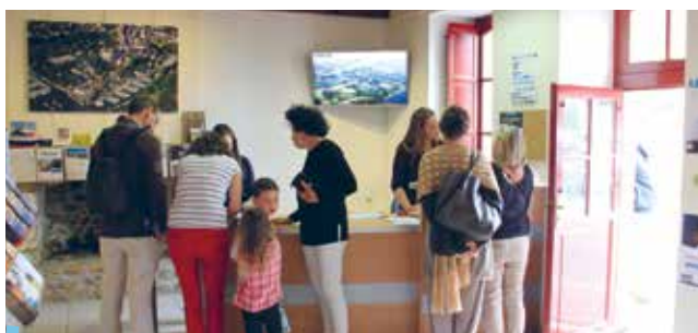
Accueil - Antenne de La Roche-Bernard

116 120 visiteurs accueillis dans les 3 bureaux principaux de Damgan, Muzillac, la Roche-Bernard et notre bureau saisonnier d'Ambon. + 2,2 % par rapport à 2016.