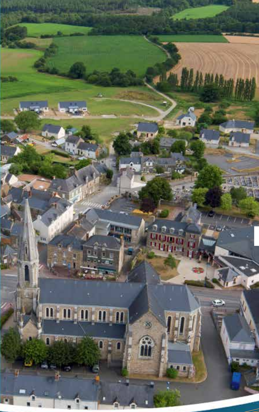
1. S-DOLAY (Morbihan) - La Cure, construite en 1717